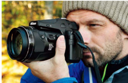
アイセンサー付き電子ビューファインダー

約236万ドットの超高精細な0.39型有機EL電子ビューファインダーを搭載。野鳥や飛行機などの動く被写体に集中しやすく、シビアな構図づくりも容易です。アイセンサーの搭載により、目を近づけるだけでモニター撮影からファインダー撮影に切り換えられます。