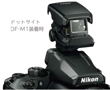
ドットサイト DF-M1装着時

3840×2160/30p対応、最長約29分の高精細な動画を撮影できます。動画撮影中のサイドズームレバーのズーム速度を[高速][中速][低速]から選択可能。ズーム中もなめらかな絞り駆動により、自然な露出変化で思いどおりのムービーを撮影できます。