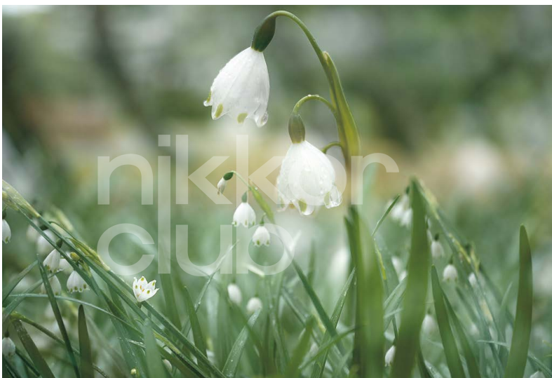
(上) 弥生2.0さん「語らい」